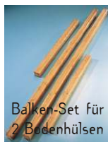
Balken-Set für 2 Bodenhülsen